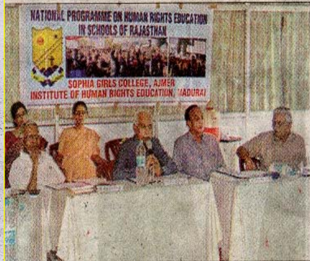
सोफिया कॉलेज में आयोजित बैठक में भाग लेते अतिथि।

यह कहना है स्टेट ह्यूमन राइट्स कमिशन के चेयरमैन एन.के.जैन का। जैन गुरुवार को सोफिया कॉलेज में ह्यूमन राइट्स एजुकेशन इन स्कूल ऑफ राजस्थान की स्टेट एडवाइजरी कमेटी की वार्षिक बैठक की अध्यक्षता कर रहे थे। ह्यूमन राइट्स इंस्टीट्यूट ऑफ मुद्रें व सोफिया कॉलेज के संयुक्त तत्वावधान में