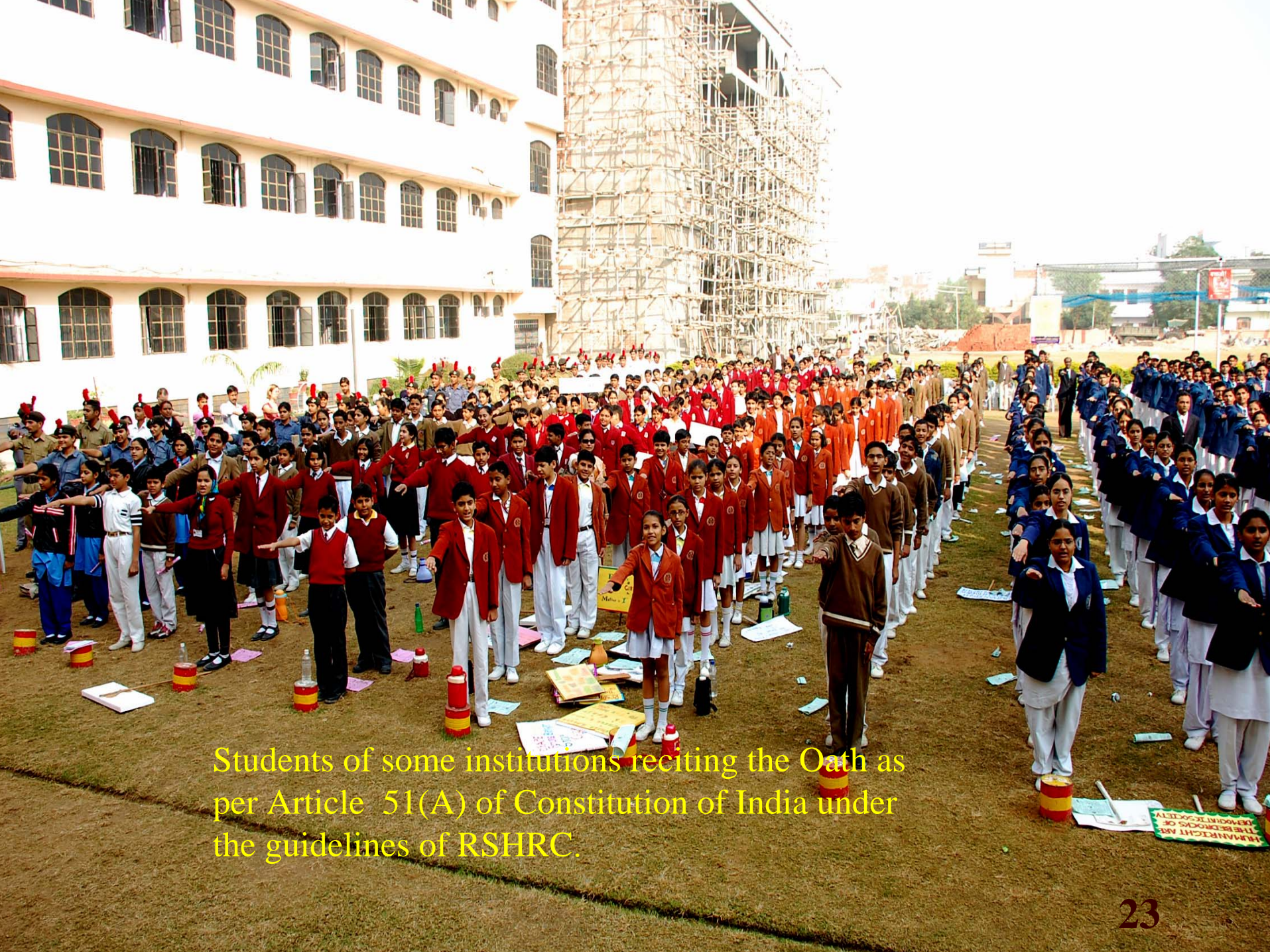
Students of some institutions reciting the Oath as per Article 51(A) of Constitution of India under the guidelines of RSHRC.