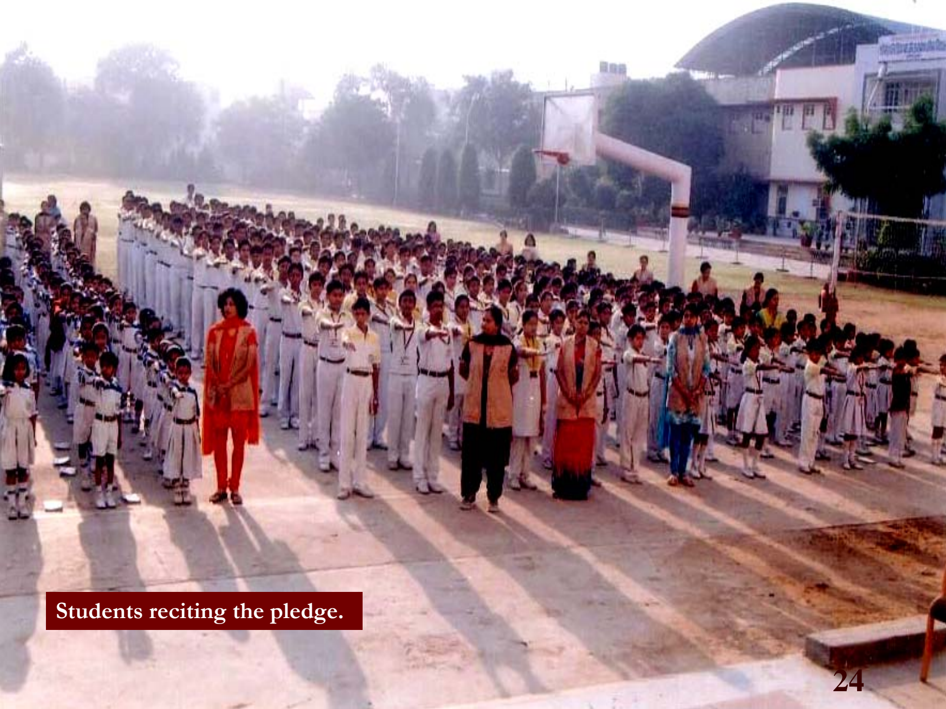
Students reciting the pledge.